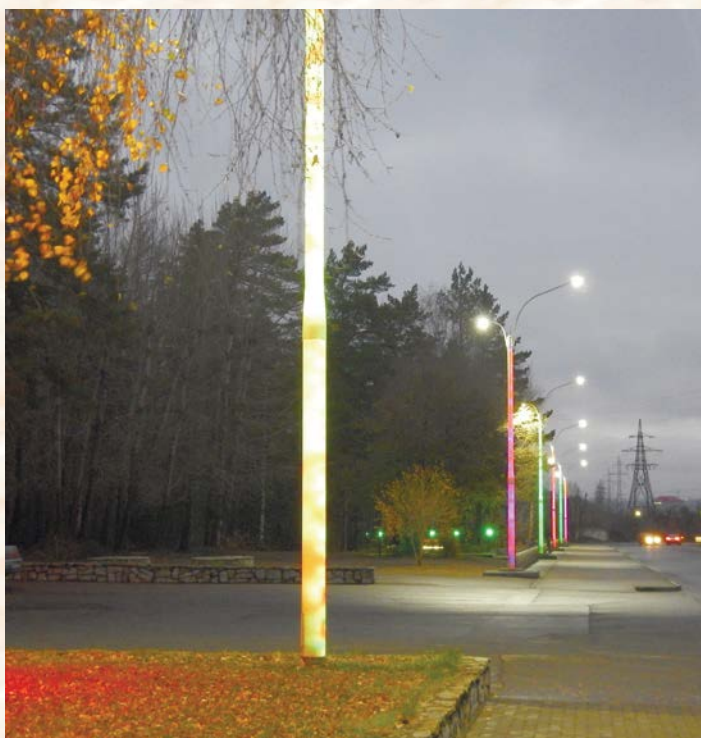
Рис. 6. Декоративные опоры освещения производства АО «НПП "Алтик"», установленные в общественных местах города Бийска

Изд-во Алт. гос. техн. ун-та, 2024. – 206 с. – URL: http://irbis.bti.secna.ru/doc14/2024-74.pdf .