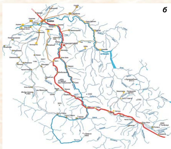
Рис. 1. Карта Алтайского края (а) и Чуйского тракта (б)