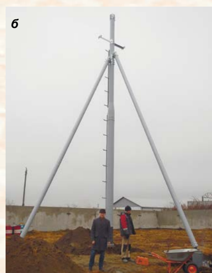
Рис. 3. Выступление к.т.н. И. И. Савина (а) и вид установленной для испытаний композитной опоры электропередачи (б)