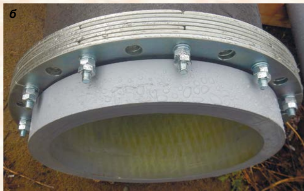
Рис. 5. Трубная продукция из композитных материалов (а) и быстроразъёмное болтовое соединение (б) от АО «НПП "Алтик"»