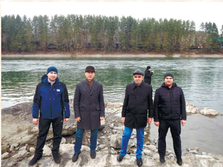
Рис. 4. Участники выездного заседания на р. Катунь

Также удалось посетить производственные цеха основного спонсора конференции – АО «НПП "Алтик"», включая участок по производству композитных труб, опор и конструкций, зону сборки и отгрузки продукции, испытательные площадки, а также обсудить с руководством возможность проведения совместных научных работ по моделированию разрушения композитных конструкций, оценке их прочности и ресурса, натурным испытаниям материалов и опор из них в условиях Якутии и Арктики. Особый интерес представляют оригинальные разработки компании (рис. 5), такие как высокопрочные композиционные трубы, в том числе модифицированные углеродными нанотрубками обсадные шахтные, не дающие искр при резке, быстроразъёмные болтовые соединения, включая для труб высокого давления, раструбные и фланцевые соединения [5].