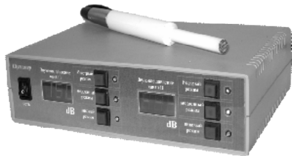
Рисунок 2 – Внешний вид измерителя акустического которого представлена на рисунке 2, имеющий следующие технические характеристики:

В результате проведенной работы создан измеритель акустического давления, фотография